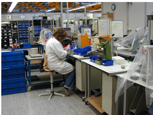
Montage mechanische Baugruppen