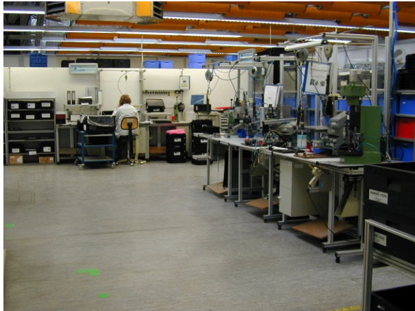
Montage elektronische Baugruppen