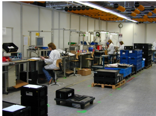
Montage elektromechanische Baugruppen